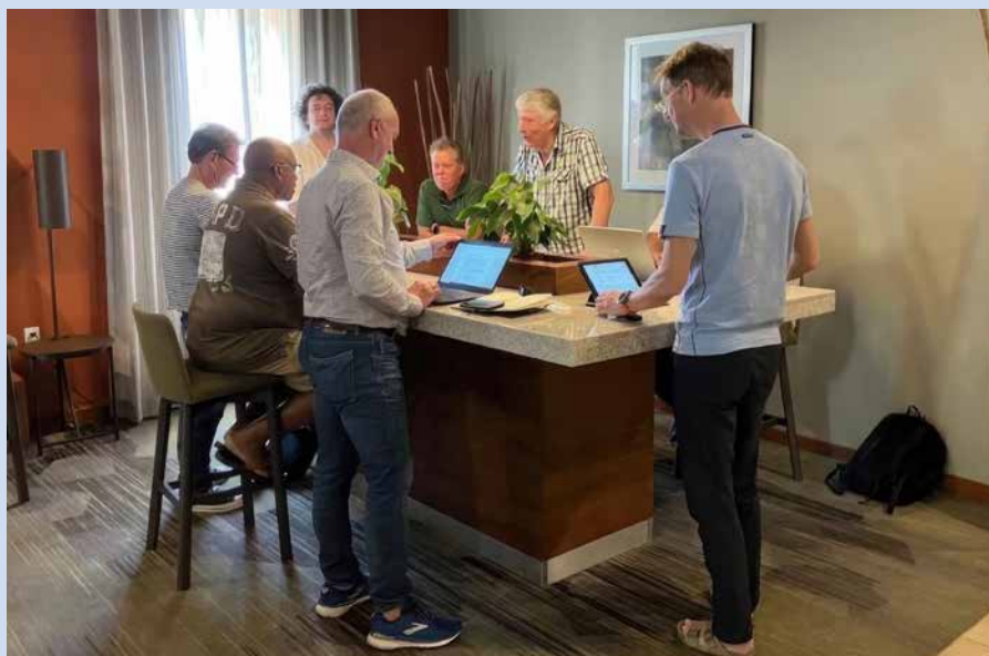
Na terugkeer in het hotel werden de bevindingen vastgelegd.

"Geen gemeente in Europees Nederland met de omvang van Bonaire zou de uitdagingen waar het eiland voor staat zonder hulp van buitenaf aankunnen. Het is in 2010 toen de BES-eilanden bij Nederland zijn gaan horen, niet goed geregeld. Ze vallen niet onder een provincie en niet onder een waterschap. Ten aanzien van het waterbeheer is de basis niet op orde. Dat is geen verwijt, maar een constatering, want dit is niet lokaal op te lossen. Je hebt heel veel professionalismen nodig.