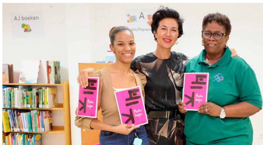
Staatssecretaris Uslu bij haar bezoek aan de bibliotheek.

Minister Harbers tekende een samenwerkingsovereenkomst voor de modernisering van Flamingo Airport (zie pagina 16). Staatssecretaris Van Huffelen brengt als coördinerend bewindspersoon geregeld een bezoek aan het eiland. Een van de onderwerpen die intensief aan de orde komt is de vernieuwing van de wet openbare lichamen BES (de WoIBES), de Caribische versie van de Gemeentewet.