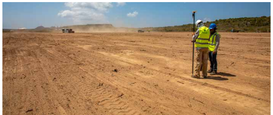
Zo veel ruimte hebben 10.816 zonnepanelen nodig.

BBT is opgericht om de veilige aanvoer van brandstof te verzekeren. Daartoe worden nieuwe opslagtanks gebouwd nabij de luchthaven. Op aandringen van de Tweede Kamer heeft het bedrijf tevens de opdracht meegekregen actief bij te dragen aan de verduurzaming van de energievoorziening. ●