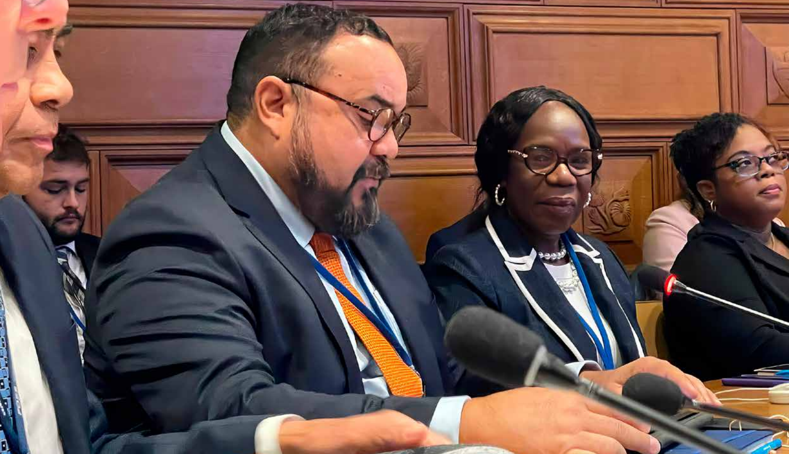
Gezaghebber Rijna tijdens zijn presentatie bij de VN Waterconferentie.