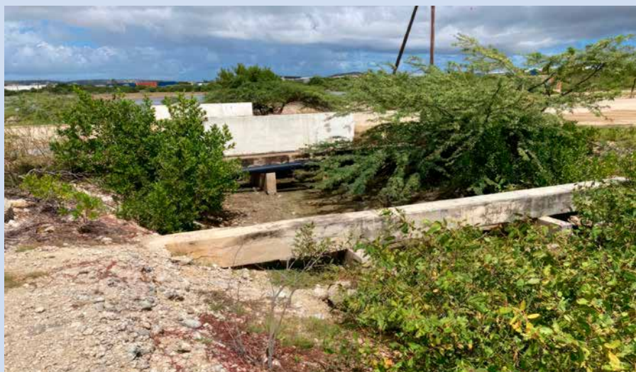
Een voorbeeld van achterstallig onderhoud.

"Ja", antwoordt Pieper als hem gevraagd wordt of hij geschrokken is van de aangetroffen situatie. "Er is groot achterstallig onderhoud over een lange tijd. De retentiecapaciteit van de salinas is volstrekt onvoldoende. Bij een dikke bui spoelt het water zo door naar het koraal, dus moeten de salinas op korte termijn worden uitgebaggerd. Het onderhoud aan de rooien en dammen heeft eveneens urgentie." Gezaghebber Rijna heeft het rapport 'Integraal Waterbeheer op Bonaire' inmiddels besproken met minister van Infrastructuur en Waterstaat Mark Harbers. Ook heeft hij het onder de arm meegenomen naar de VN Waterconferentie in New York waar hij spreker was op een sessie over waterbeheer in small island developing states. Pieper en zijn collega's hebben laten weten graag betrokken te blijven. Hun rapport dat waterbeheer in de volle breedte bestrijkt, is te lezen op bonairegov.com .