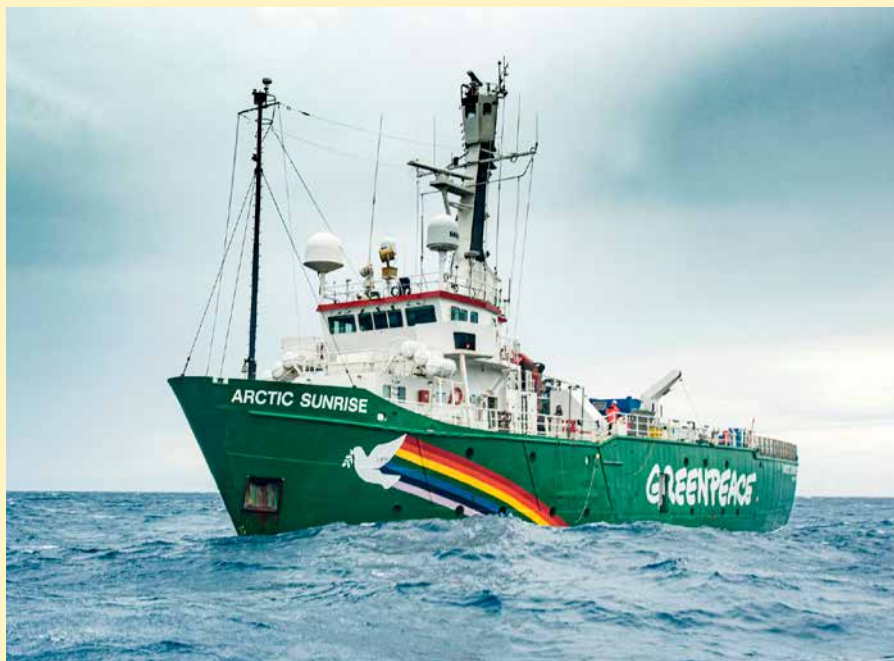
De Arctic Sunrise is van 20 tot en met 27 april op Bonaire.

"'Typisch Greenpeace' is dat we goed onderzoek doen, samenwerken met mensen en via de politiek en als het nodig is via de rechter proberen dingen te veranderen. We sluiten zeker niet uit dat we in de toekomst ook acties zullen inzetten om samen voor de toekomst van Bonaire op te komen." ●