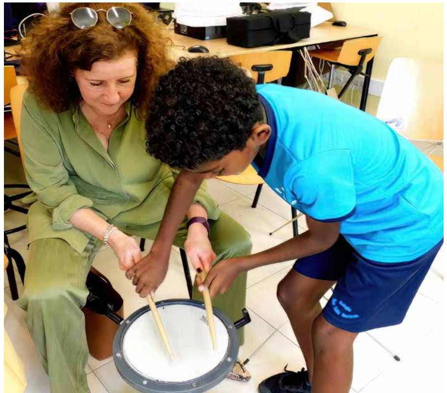
In 2021 kreeg het Leerorkest Bonaire bezoek van toenmalig minister van OCW Ingrid van Engelshoven.maatschappelijke aard."