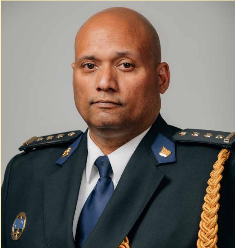
Korpschef Alwyn Braaf: Het korps staat er goed voor.

Het veiligheidsgevoel van inwoners en bezoekers van Bonaire ligt aanzienlijk hoger dan het landelijk gemiddelde. Dat is mede te danken aan het Korps Politie Caribisch Nederland dat even kort bestaat als Bonaire een bijzondere gemeente is. Bij de ontmanteling van het land Nederlandse Antillen in 2010 kregen Bonaire, Sint Eustatius en Saba samen een eigen korps met formeel de minister van Justitie en Veiligheid als korpsbeheerder.